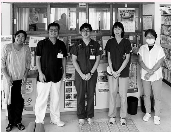
離島研修の研修先にて(西表大原診療所、写真中央が筆者)

手前味噌ではありますが、このような温かい方々に囲まれて自己研さんできる病院として大館市立総合病院は医学生の中でも人気の研修病院の一つです。普段の診察や検査などの診療の場で私たち研修医が同席させていただく事があると思いますが、何卒よろしくお願いいたします。私たちも少しでも早く一人前となり大館の医療に貢献できるように精進して参ります。