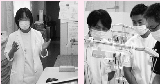
放射線科、臨床検査科での研修

当院では、地域医療を学ぶ実習生や研修医を受け入れ、地域に寄り添った特色ある医療を体験してもらっています。総合診療科では、体の部位や専門領域にとらわれず、急性期から慢性期まで幅広い視点での診療を実習し、また、訪問診療・訪問看護では、在宅医療療養患者の診察や終末期の援助など、患者さん一人ひとりの顔が見える実習内容となっています。