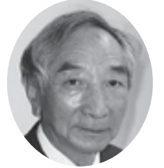
市立総合病院 院長 ひろし 博 たて 館 おか 岡