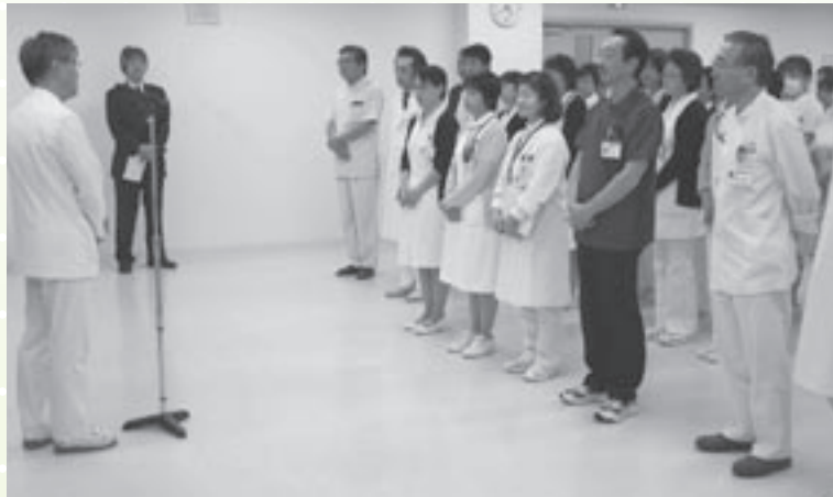
認定報告会の様子

病院機能評価は、病院が組織的に医療を提供するための基本的な活動（機能）が、適切に実施されているかどうかを評価する仕組みです。評価調査者（サーベイヤー）が中立・公平な立場で、定められた一律の評価項目に沿って病院の活動状況の評価します。評価の結果明らかになった課題に対し、病院が改善に取り組むことで、医療の質の向上が図られます。