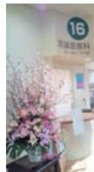
やっぱり桜は最高!