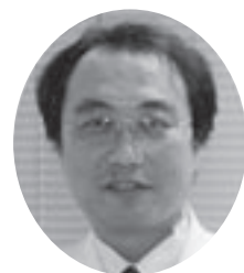
市立扇田病院 院長 樹 直 きの 院な 本 お 大

今後は、これに満足すること無く、職員一丸となって市民の皆様へ愛される病院作りに取り組んで行きたいと思っております。引き続き、市民の皆様への叱咤激励をよろしく願います。