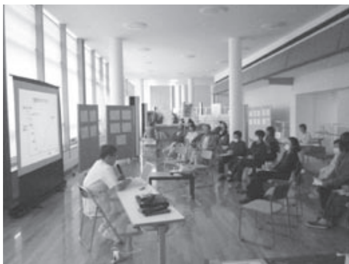
昨年度行った、『もっともっと知ろう緩和ケア(患者さん向け講演会)』の様子です