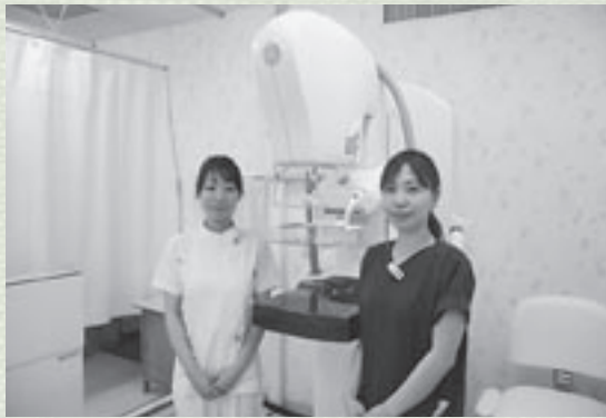
最新の乳房X線撮影装置と女性技師