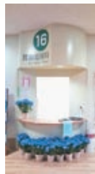
梅雨も嬉しくなる紫陽花