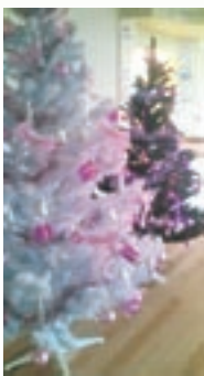
みんな大好きクリスマス

耳鼻咽喉科は耳、鼻、のどの病気を診療する科です。咽喉とは咽頭・喉頭の略で、のどのことを意味します。耳、鼻、のどの調子が悪い時は、耳鼻咽喉科を受診してください。また、めまいも耳鼻咽喉科で扱うことが多い症状です。なぜならめまいの原因は耳の障害のことが多いからです。耳自体には何の自覚症状もないこともあります。お困りの方はご相談ください。また、睡眠中に激しいいびきをかいたり、呼吸が止まるなどして全身に悪影響を及ぼす睡眠時無呼吸症候群も、鼻やのどに原因がある場合が多く、力を入れて治療しています。 当科の外来診療は医師2人を含めた8人のスタッフで行っておりますが、その診療理念は、 ラブ&ハッスル です。この言葉には、患者さんに愛をこめて、そして私たちも元気に楽しく働きたいという願いがこもっています。これからもこの様な精神で、皆さんとの両想いを目指して参りたいと思います。また季節季節で、外来の装飾にもこだわって行きたいと考えています。ささやかではありますが、皆さんと大館の四季を共有出来る科受診がなくともぶらりと立ち寄りください。