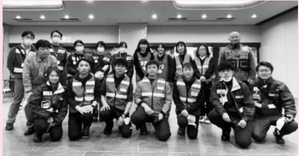
JMAT福井、保健師、加賀市役所の方々とともに

午前中は加賀市のホテルに設置した救護所内で保健師や市役所職員とともに救護所活動を行い、午後は各避難所へ訪問して施設の状態を聞き取りしながら往診を行いました。我々が活動した時期は加賀市内の病院