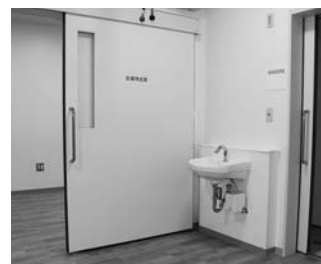
↓ トリアージルーム