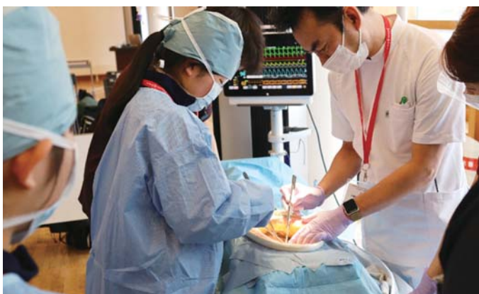
手術室体験コーナーの様子