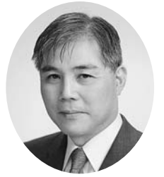
大館市病院事業管理者 市立総合病院長